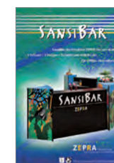
SansiBar die attraktive Bar zum Mieten A5-Infolyer, 4 Seiten