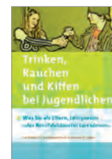
Vorliegende Broschüre A5, 16 Seiten

Bestellungen (bis 30 Stück gratis) per Telefon 071 229 87 60 oder E-Mail st.gallen@zepra.info Die Gratisbestellungen gelten nur für Personen, Institutionen oder Betriebe, die im Kanton St. Gallen ansässig sind. Grössere Bestellmengen auf Anfrage.