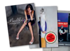
Plakate und Karten Je 3 Sujets zu Alkohol, Tabak und Cannabis Bestellung über ➤ www.be-freelance.net