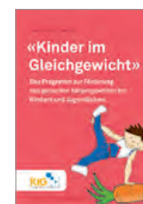
Kinder im Gleichgewicht Allgemeine Informationen A5-Leporello, 6 Seiten