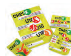
CheckPoint Jugendschutz Diverses Material Bestellung über ➤ www.zepra.info