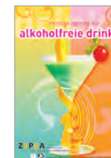
10 trendige Rezepte für alkoholfreie Drinks A5-Leporello, 6 Seiten