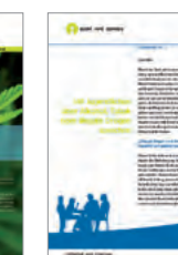
A4 Broschüren zu verschiedenen Suchthemen sowie die aufschlussreichen Elternbriefe mit Tipps zur Suchtprävention. Download oder Bestellung sind kostenlos: ➤ www.sucht-info.ch